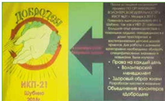
Эмблема волонтерского клуба «Добродея» п. Шубино, ИКП

Для большинства осужденных представленные и использованные материалы на тренингах являлись совершенно новой формой обучения, с которой они