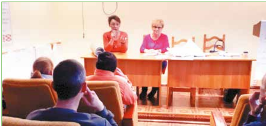
07.11.18. Проведение занятия учебного курса «Права на каждый день»

Семья. Права и обязанности родителей и детей. Лишение и восстановление в родительских правах. Наследство, дарственная, завещание.