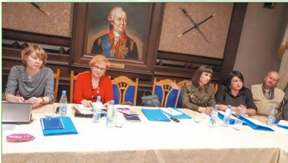
26.11.2018 г., г. Гомель. Круглый стол по итогам проекта «Социальная адаптация осужденных через образовательную и волонтерскую деятельность»