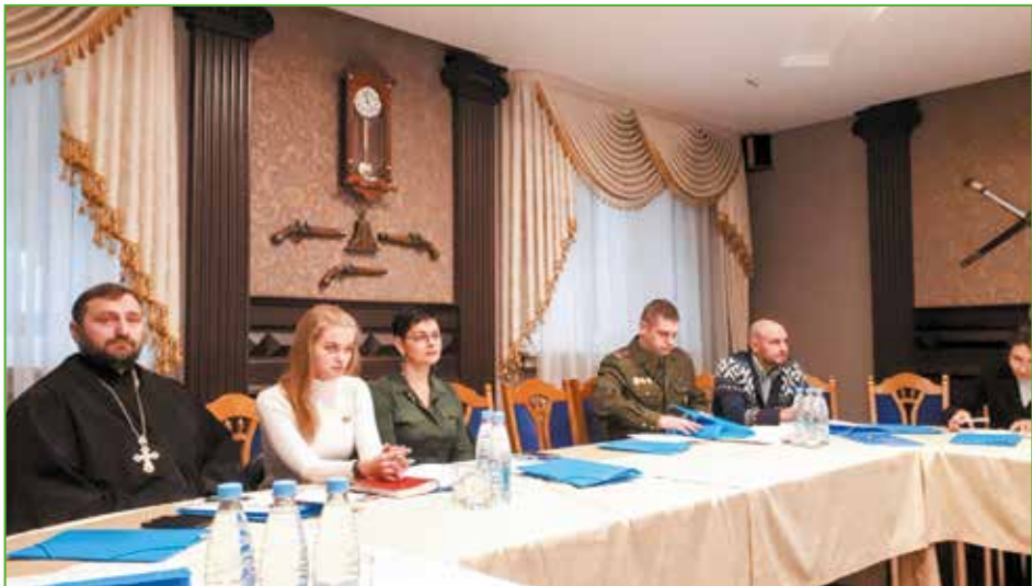
26.11.2018. г., Гомель. Круглый стол по итогам проекта «Социальная адаптация осужденных через образовательную и волонтерскую деятельность»

И как результат – реализация на базе ИКП ОО «Амрита» мини-проекта «Социальная адаптация осужденных через образовательную и волонтерскую деятельность», финансируемого Представительством зарегистрированного общества «Deutscher Volkshochschul-Verband e.V.» (ФРГ) в Республике Беларусь (Представительство Немецкой ассоциации народных университетов).