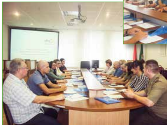
06.09.18 г. Гомель. Стартовый круглый стол с целью информирования о мероприятиях проекта