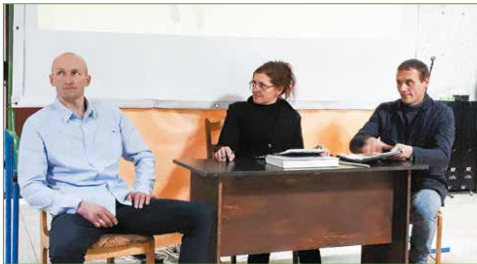
25.11.2018 г., п. Шубино, ИКП.

Осужденные из числа волонтеров вот уже почти два года еженедельно посещают своих подшефных: дом-интернат для инвалидов и участников ВОВ в п. Шубино и Хальчанский СПЦ. На счету волонтеров уже немало реализованных акций по улучшению быта их подопечных. Это и благоустройство детского приюта: волонтеры произвели ремонт в спальном комнате детей, оформили стены сказочными рисунками, отремонтировали крышу, установили игровую