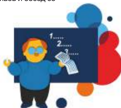
КОНФЕРЕНЦИИ и учебные визиты