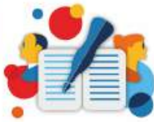
ЦЕНТРЫ образования взрослых