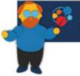
АДУКАТОРЫ: тренеры и андрагоги