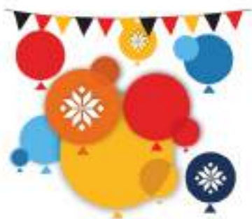
ФЕСТИВАЛИ неформального образования

На совместном изучении истории основан также один из первых тематических проектов Представительства DVV International в Беларуси «Белорусская школа в Каме: от шансов к праву на образование» (2010-2011). Проект был реализован в рамках программы «Европейцы за мир» фонда «Память, ответственность и будущее». Основная цель проекта — исследование доступа к образованию в послевоенный период в Германии и Беларуси для различных групп молодежи. Школьники из городов Кам (Германия) и Новогрудок (Беларусь) изучали историю создания и работы Белорусской гимназии имени Янки Купалы, которая существовала в послевоенные годы в деревне Михельсдорф под Камом. Участники проекта проводили исследование, общались со свидетелями исторических событий, обменивались результатами своей работы онлайн и подготовили выставку о праве на образование на родном языке, включающую элементы сравнения современных систем образования в Беларуси и Германии.