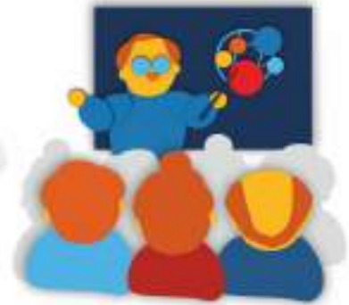
Образование взрослых и креативная экономика