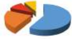
ИССЛЕДОВАНИЯ потребностей в обучении