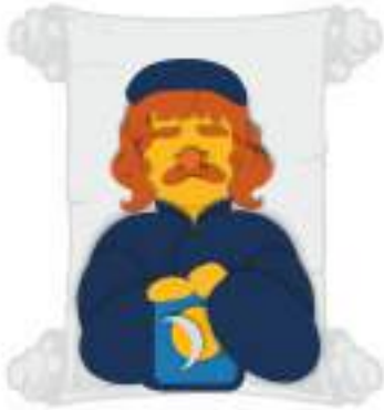
Образование, культура и история для местного развития