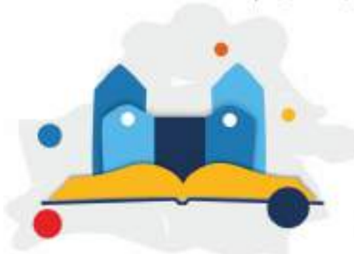
Обучающиеся регионы и города