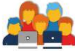
РАЗВИТИЕ ПОТЕНЦИАЛА специалистов и организаций (круглые столы, дискуссии, публичные лекции т.д.)