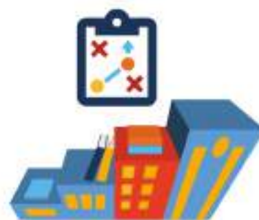
СТРАТЕГИИ “обучающихся городов” и рекомендации